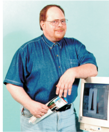
Multimediaentwickler in natürlicher Umgebung

Als Teamleiter betreue ich ehrenamtlich eine Gruppe für Video- und Fotobearbeitung im Computer Club Ostfriesland e.V. und bin auch oft selbst mit Video- und Fotokamera unterwegs.